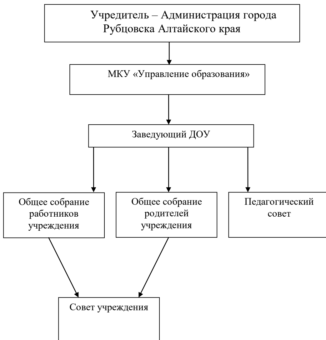
Таблица № 3