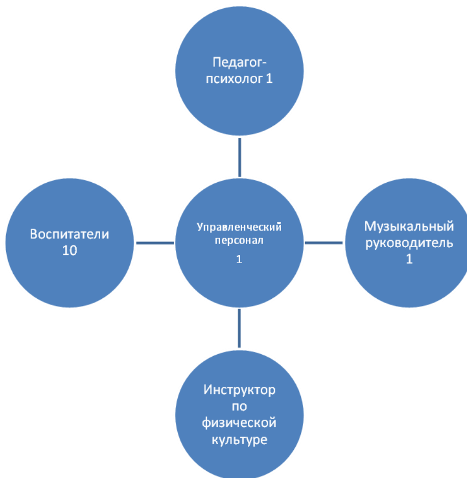
Таблица № 23