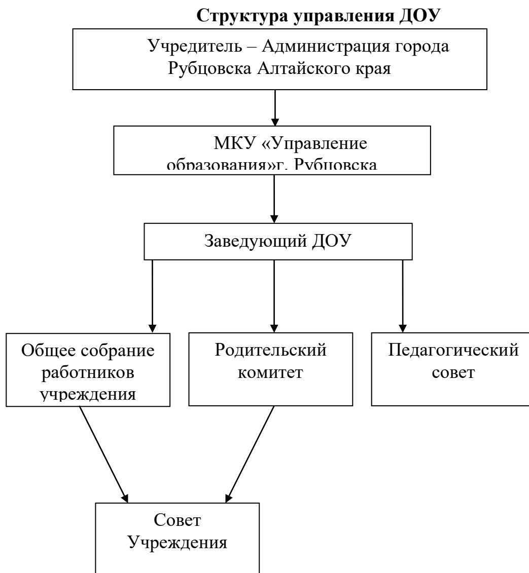
Таблица № 2