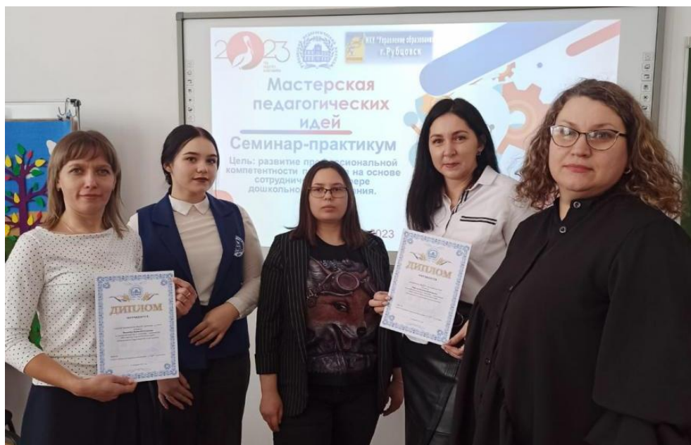
КГБПОУ «Рубцовский педагогический колледж», семинар-практикум «Мастерская педагогических идей», посвященный Году педагога и наставника 2023 год.

Наш сад активно сотрудничает с социальными партнёрами, способствующими расширению социального пространства и обогащению содержания образовательного процесса для воспитанников. А именно: МБУДО «Детская музыкальная школа №2» г Рубцовска, МБУК библиотечная информационная система, центральная городская библиотека, МБУК Краеведческий музей города Рубцовска, театр кукол имени А. К. Брахмана, ГБДД МО МВД России Рубцовский и многие другие. Благодаря плодотворному взаимодействию наше учреждение получило грамоту за многолетнее сотрудничество при организации педагогической практики студентов специальности «Дошкольное образование», высокий профессионализм и педагогическое мастерство в 2023 году от КГБПОУ «Рубцовский педагогический колледж»