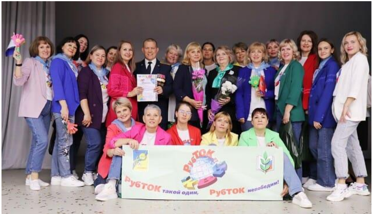
Команда КВН «Руб.ТОК.ру» г. Рубцовск

Наши педагоги творческие, креативные, веселые и находчивые принимали участие в составе сборной команды из дошкольных образовательных учреждений города Рубцовска «Руб.ТОК.ру» в краевом фестивале КВН для педагогов дошкольных образовательных организаций, завоевав в 2024 году 1 место и в 2025 году 2 место.