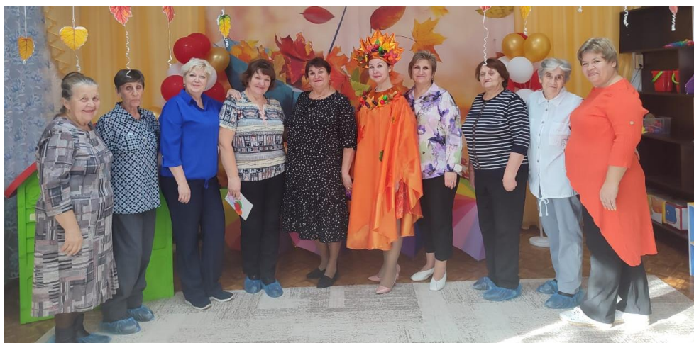
Ветераны МБДОУ «Детский сад 49 «Улыбка»

Особое внимание уделяем работе с ветеранами труда нашего учреждения.