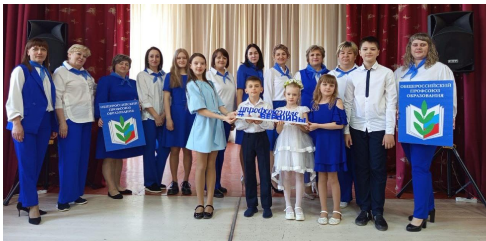
Коллектив МБДОУ «Детский сад №49 Улыбка» Конкурс песни «Душа Профсоюза поёт...» 2025 (3 место);

Первичная профсоюзная организация нашего сада является структурным звеном Территориальной Организации Профессионального союза работников образования и науки РФ г. Рубцовска и Рубцовского района.