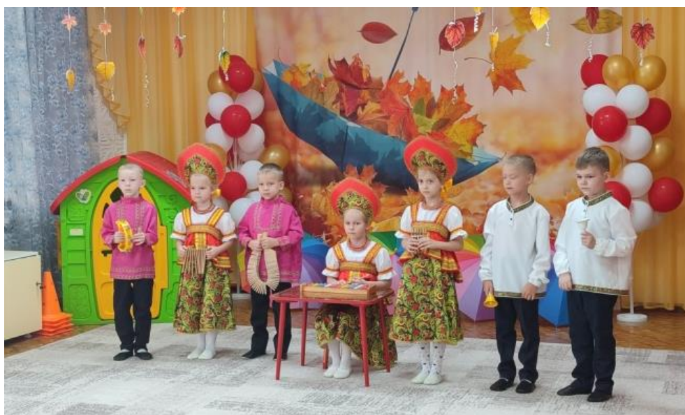
Выступление кружка «До-ми-соль-ка».

Программа обеспечивает формирование навыков вокального исполнительства, способствует развитию музыкального слуха и певческого голоса, эмоциональному и нравственному развитию Обучающихся, становлению полноценной нравственной личности ребенка.