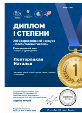
Педагогический состав МБДОУ «Детский сад №49 Улыбка 2024 год

Наш дружный коллектив - единая творческая и инициативная команда, которая активно принимает участие в различных конкурсах.